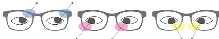
斜め上の物を見る場合、レンズの青マーク周辺を使っています。

全方位の眼の動きを考慮した設計です。左右のレンズを非対称な設計にすることで、上下・左右を見る時のクリアな視界を確保し、常に快適な視界が得られます。