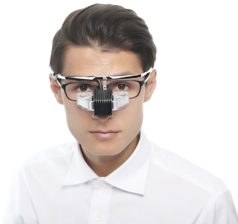
【「オーバークラス型の製品設計」メガネの上からも着用可能】

ハードウェアとして「見え方」に高い評価を頂いている「b.g.」ですが、装用者が「b.g.」本来の機能を継続的に最大限活用し続けるには「装用者の眼の状態を適正化すること」が重要となります。「b.g.」のように視覚に関わるデバイスの利用においては、「装用者の眼の状態」がデバイスを視るために適切な状態になっていない場合、十分な満足が得られにくいいため、「b.g.」はオーバークラスタイプの設計を採用しており、視力矯正が必要な方が、ご自身の眼の状態に最適なメガネをかけたまま「b.g.」を装着できる仕様となっています。